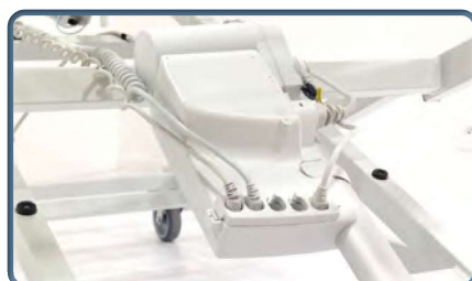
Sterownik na siłowniku regulowanej wysokości dla ograniczenia hałasu i wibracji