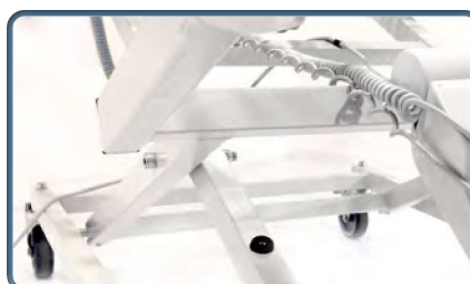
Poszerzona rama zapewnia stabilność boczną