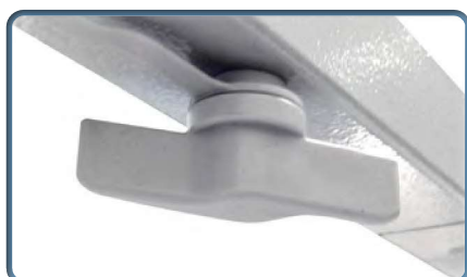
Bolce blokujące wzmacniają dwuczściowy stelaż leża