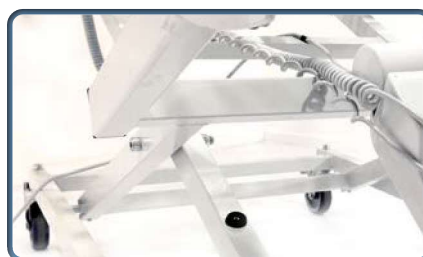
Poszerzona rama zapewnia stabilność boczną