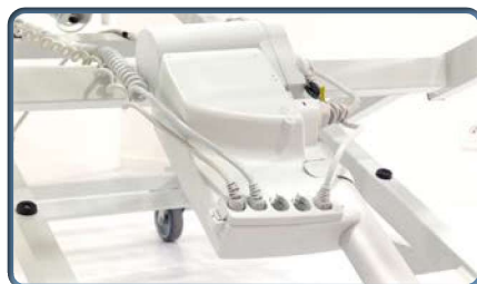
Sterownik na siłowniku regulowanej wysokości dla ograniczenia hałasu i wibracji