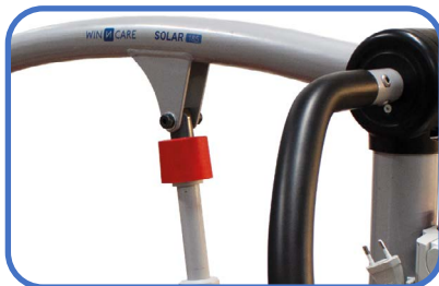
Ręczne awaryjne opuszczanie.