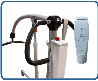
Przyjazny dla użytkownika pilot i sterownik Linak.