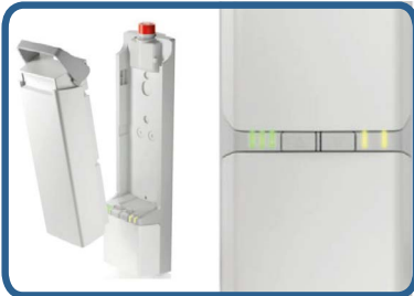
Sygnalizacja LED na sterowniku z informacją o akumulatorze i ładowaniu, serwisie, stanie systemu (przeciążenie, zatrzymanie awaryjne itp.).