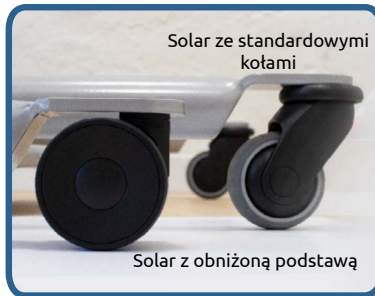
Solar ze standardowymi kołami