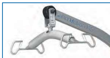
4- punktowy wieszak