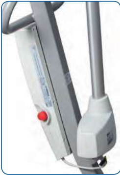
Przycisk awaryjnego zatrzymania