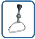
Wysięgnik ręki z kołowrotkiem (3) Dostępny też wieszak na kropłówki

Panel WINNEA® CIC (2) z odbojnikami, szczyty tworzywowe wykonane w technologii z jonami srebra CIC