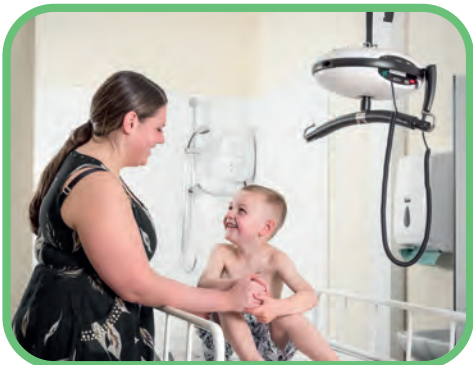
Czynności pielęgnacyjne i kąpielowo-toaletowe