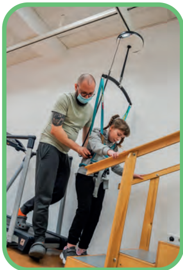
Pionizacja i rehabilitacja