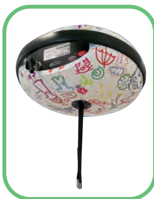
Luna dla dzieci