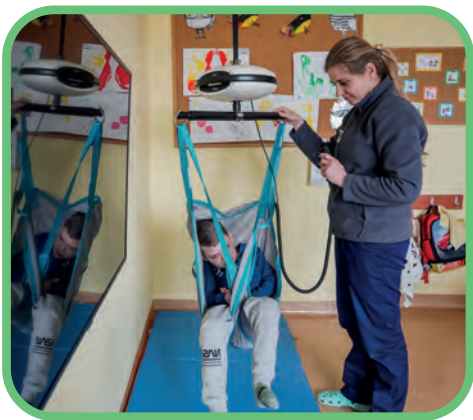
Podnoszenie i przemieszczanie