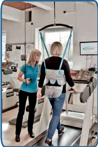
Ergo Trainer- gwarantuje bezpieczną i efektywną rehabilitację

„Bez systemu odciążeniowego trudno jest rehabilitować pacjentów z ograniczoną możliwością chodzenia, ponieważ strach przed upadkiem uniemożliwia efektywny i ciągły proces rehabilitacji.”