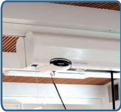
Ergo Trainer może być montowany do sufitu lub na stelażu