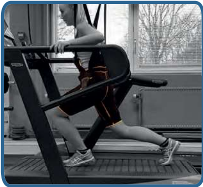
Rehabilitacja z Ergo Trainer po urazach sportowych