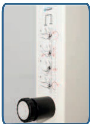
Łatwa regulacja wysokości (mechanizm sprężyny gazowej). Prosta instrukcja znajduje się nad uchwytem