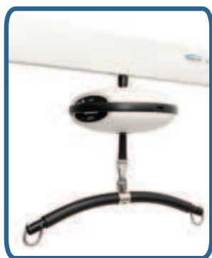
Podnośnik sufitowy Luna zamontowany na urządzeniu Mobile Flex